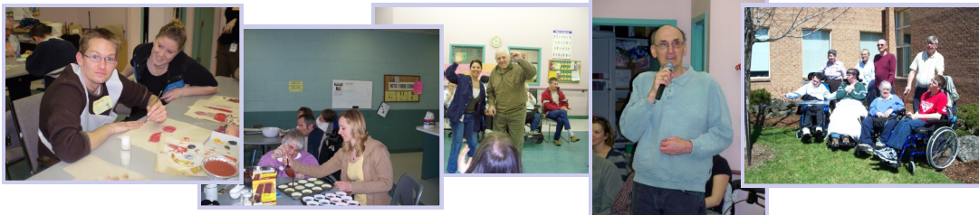
Activités du programme PET