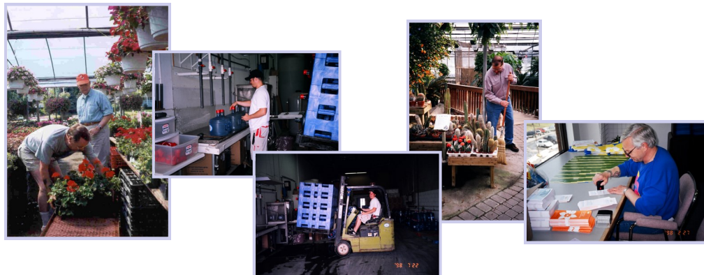
Activités d'initiatives bénévoles et de placements d'emploi

Le programme professionnel propose les choix suivants :